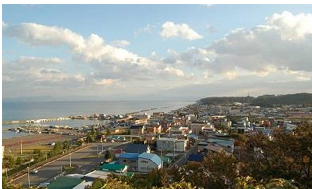
外ヶ浜町蟹田地区のまちなみ