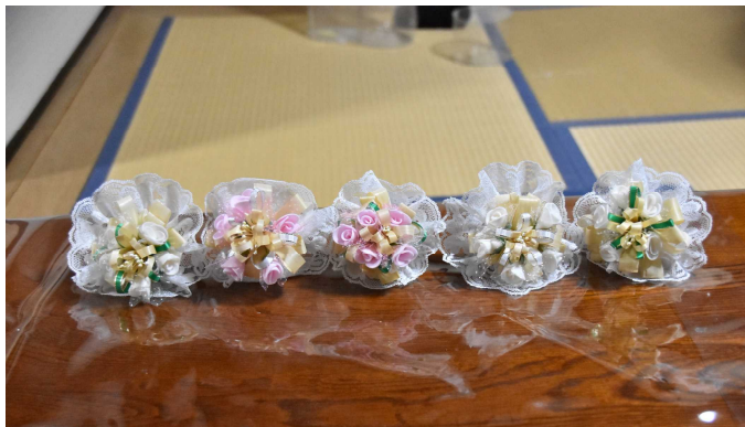
3年生(5人)の色とりどりのコサージュ