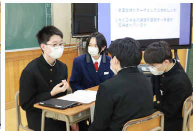
生徒会テーマをグループで検討