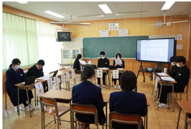
よりよい学校を目指す生徒総会