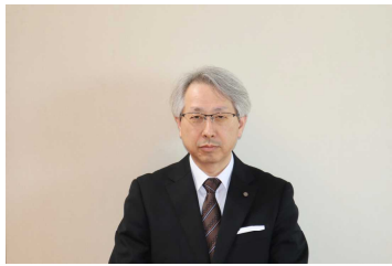
校長 めと き せい じ 目時 聖児