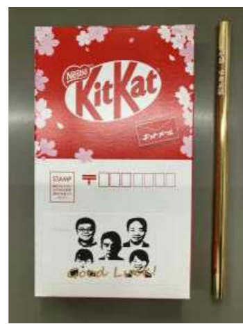
郵便局からのキットカット