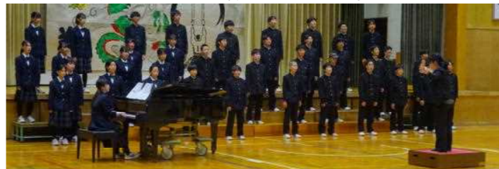
全校生徒による合唱