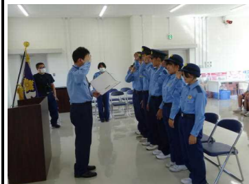
外ヶ浜警察署長より辞令交付されました。

9月27日に外ヶ浜警察署で一日警察署長・幹部体験を行いました。外ヶ浜警察友の会から依頼され、Jumpチーム代表6名の生徒が署長・幹部となり、全校生徒で鑑識活動体験・護身術訓練の体験やパトカー・白バイ・施設の見学を行い、最後には警察音楽隊の演奏を聴くことができました。日頃から地域の安心・安全なまちづくりに取り組む警察の業務を理解しながら貴重な体験をすることができました。