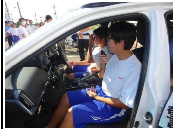
パトカー、白バイ乗車体験