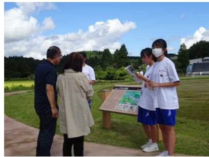
蟹中生による遺跡ガイド