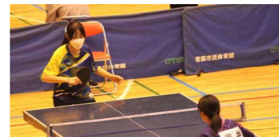
女子個人2回戦敗退