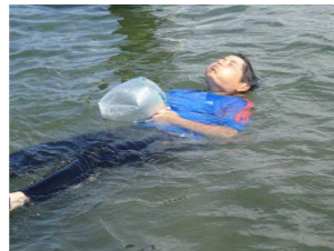
身の回りの物（ペットボトル、ビニール袋等）を使って浮き身をとる