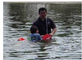
レスキューチューブを使つての救助法