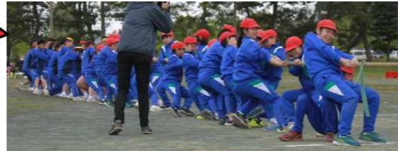
小中合同で行った綱引き