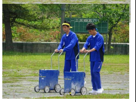
ライン引きは陸上部が担当しました。