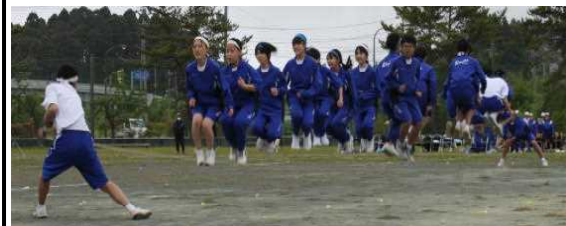
どちらも美しい Team Jump