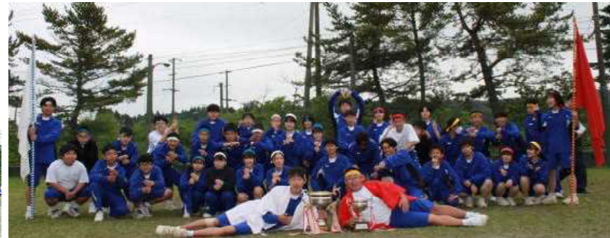
全校生徒集合写真