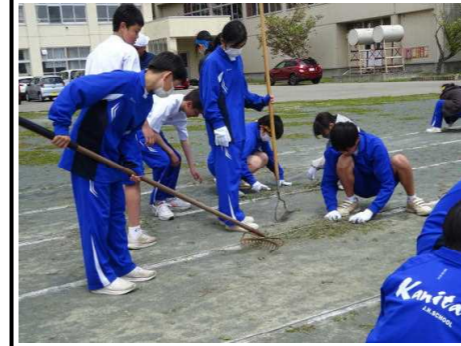
雑草の根が走路に張り巡られていました。

運動会前日は全校生徒で小学校のグラウンド整備をしました。走路には雑草の根が生えていて取り除くのに苦労していましたが、安全に走れるようになりました。ご苦労様でした。