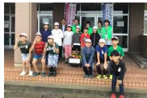
令和6年度 人権「花いっぱい運動」

6月24日(月)に外ヶ浜地区人権擁護委員会様よりお花の鉢植えをいただきました。友だちを大切に育てる心を育むことをねらいとしています。職員玄関前に飾っておりますので、来校の際にはぜひご覧ください。