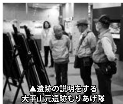
▲遺跡の説明をする大平山元遺跡もりあげ隊

御所野遺跡と是川遺跡へ行ったモン♡ 大平山元遺跡展示施設むーもん館と大平山元遺跡もりあげ隊は、遺跡のPRと世界遺産「北海道・北東の縄文遺跡群」構成資産の活動団体との交流のため、「出張むーもん館」として10月18日(土)に岩手県一戸町の御所野遺跡・御所野縄文館、11月3日(月)に八戸市の是川縄文館へ行ってきました。 両館では、遺跡の紹介パネルやリーフレットを用いた遺跡の説明やミュージアムグッズの販売を実施しました。「出張むーもん館」は来年度も実施予定です。