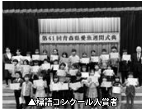
▲標語コンクール入賞者

第61回青森県愛魚週間式典が開催されました 11月7日(金)、外ヶ浜町中央公民館において「第61回青森県愛魚週間式典」が開催されました。 この式典は、内水面漁業協同組合がある県内の市町村を会場に毎年開催されているもので、今年度は「蟹田川漁業協同組合」がある当町を会場にして開催されました。 式典では、内水面に関する標語コンクール入賞者の表彰が行われ、県内の小学校から応募された多数の作品の中から35作品が選ばれました。 町内の小学校からは8作品が選ばれ、入賞した子供たちが