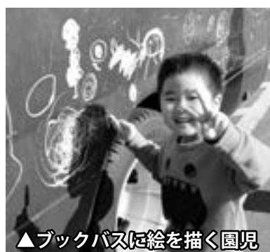
▲ブックバスに絵を描く園児

園児の絵で彩られたブックバスが出発！ 11月4日(火)、風のまちこども園において、絵本の読み聞かせとブックバスの落書き体験が行われました。 読み聞かせには青森大学の秋田先生をお招きし、クリスマス絵本や、ダンスをしながら読み進めていく絵本に、園児たちは聴き入っていました。 当日は晴天に恵まれ、本が約1000冊積まれたバスの車体に、園児たちは思い思いにクレヨンで落書きをしました。このブックバスは、これまで園児たちを送迎してきたバスを改造したものです。 ブックバスは、クリスマスの時期に町内を巡る予定です。