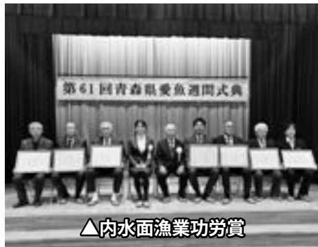
▲内水面漁業功労賞

に表彰状と記念品が手渡されました。 また、当町における内水面環境保全等に寄与した4団体、個人3名についても、長年にわたる功績に対して内水面漁業功労賞が授与されました。 県内でも有数の「しろうお」の産地である蟹田川。また、町内に多数ある河川では「アユ」「イワナ」「ヤマメ」などの豊富な水産資源があり、今後も継続的な内水面環境の保全が求められます。 きれいで豊かな外ヶ浜町の「川」を、これからもみんなで守っていきましょう。