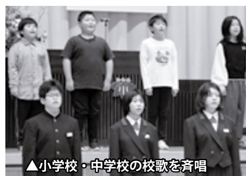
▲小学校・中学校の校歌を斉唱

り、各種活動には国からの財政措置があります。 今回、支援員となった3名は、「会館設備や花壇の整備をして、集いの場をつくりたい。」「草刈りや除雪、側溝の泥上げなどを地区住民みんなで協力してやりたい。」「有害鳥獣対策をみんなで考えたい。」「といった活動への思いを各々話していました。 今後、3地区においては、支援員がアンケートの実施、集会の開催などのご案内をすることがあるかと思えますので、皆さまのご協力をお願いいたします。