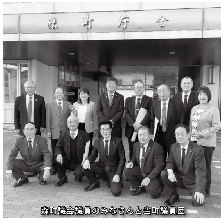
森町議会議員のみなさんと当町議員団

11月28日、第153回臨時会を開催し、補正予算案6件及び条例案3件を原案のとおり可決し、報告案件1件を承認しました。