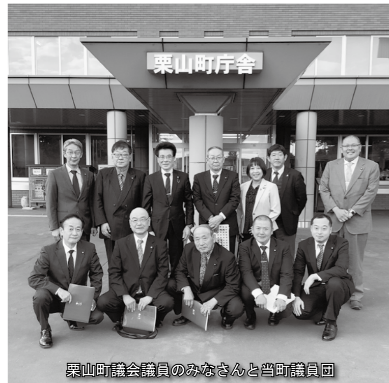
栗山町議会議員のみなさんと当町議員団

我々町村議員は、近年、なり手不足が深刻な問題になっていきます。議員年金の廃止も一因ではありますが、県・市議会と比べ低い報酬もまた要因の一つであり、議員報酬だけでは生活していけない実態があります。 「志があるのに議員になれない」 そういった課題に取り組んでいる議会の一つである北海道栗山町を視察し、なり手不足解消の方策を学んできました。 栗山町では、全国に先駆けて議会が中心となり