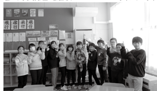
蟹田小学校各教室に設置されたエアコン（上4学年、下5学年）