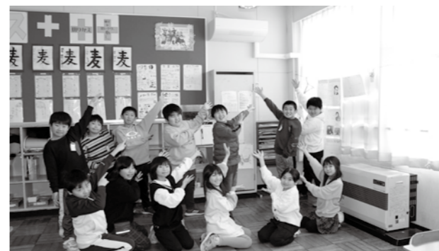
蟹田小学校各教室に設置されたエアコン（上4学年、下5学年）

とである。県、国に対して言うべきことはきちんと言ってほしい。 答 副町長 通常は、ヒアリング申請しそこで書類を確認し、県で受理し国へ上げる。今回、交付申請した後にヒアリングし、資料を出せとか駄目だというのは、あまり聞いたことがない。こういうことが二度とないように、県なり国にしっかり申し上げていきたい。