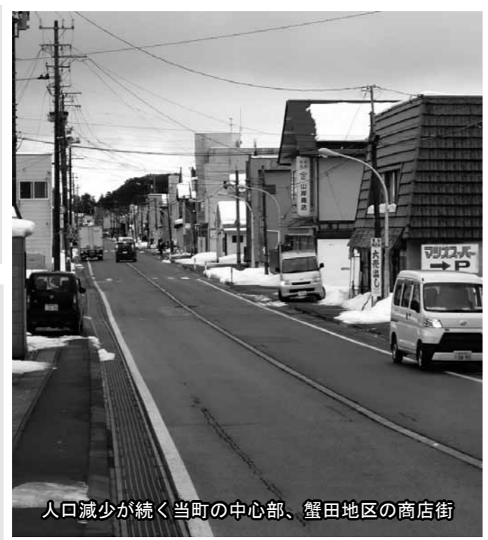
人口減少が続く当町の中心部、蟹田地区の商店街