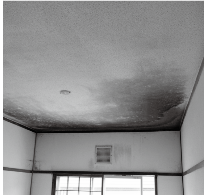
三厩地区新町団地、空室の天井のカビ