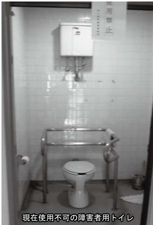
現在使用不可の障害者用トイレ