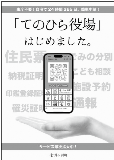
LINEアプリ「手のひら役場」

うが、今後、他の支払い方法の計画はあるのか。 答 総務課長 今後、利用者が拡大し、要望等がありましたら、他の支払い方法も検討していきたい。