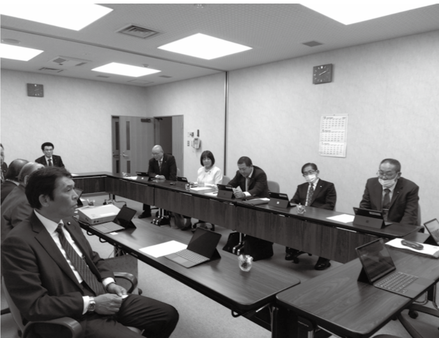
タブレット端末の使い方を学ぶ当町議員

今臨時会では、青森県人事委員会の勧告により、期末手当の支給割合を改める条例の改正、および、人件費の調整を行いました。