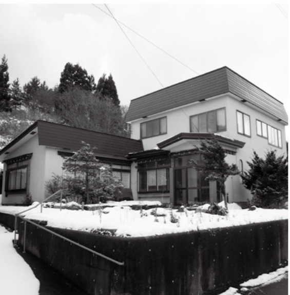
現在空き家になっている民家

答 町長 今回の案件は議決事項でなく、相談が多くなるお盆前までに本制度を町民に紹介したいとの理由から、6月に定めた。