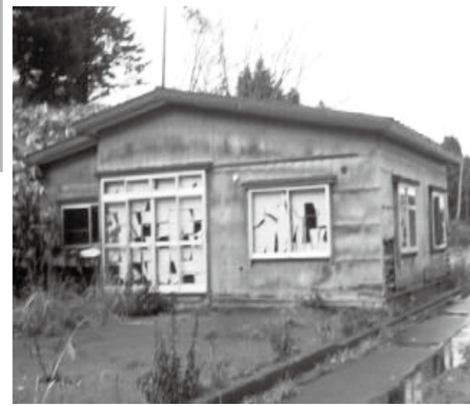
平箱地区の町営住宅

答 町長 6月から制度を運用し、問い合わせ4件、実地調査件数3件、契約に至つた件数はゼロ件となっている。