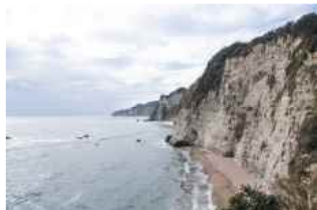
半島振興対策実施地域

このような課題に半島地域が打ち勝つには、地域活性化の核となる産業の振興を図ることが非常に重要です。そのため、国や地方公共団体は、半島振興法等に基づき、国税と地方税の優遇措置（半島税制）を導入し、法人税や固定資産税などの負担軽減を図り、半島地域内の事業者の皆様への積極的な設備投資を後押ししています。