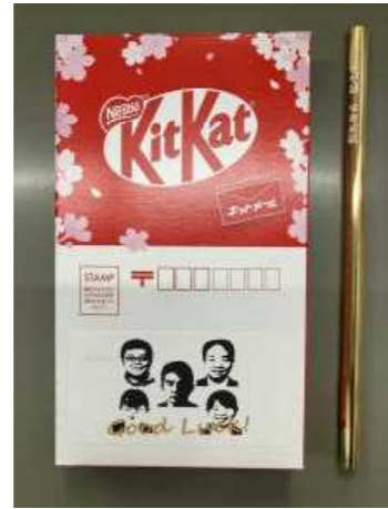
郵便局からのキットカット