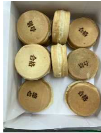
学校からは合格おやき