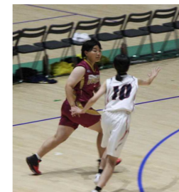
蓬田中と合同チーム