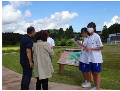
蟹中生による遺跡ガイド