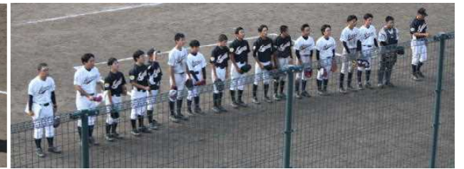
平内中との合同チーム