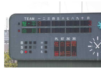
初戦対油川3点先取