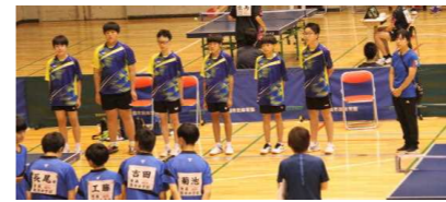
男子団体予選リーグ敗退