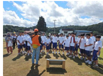
最後にボランティアガイドによる説明を全員で聞きました。