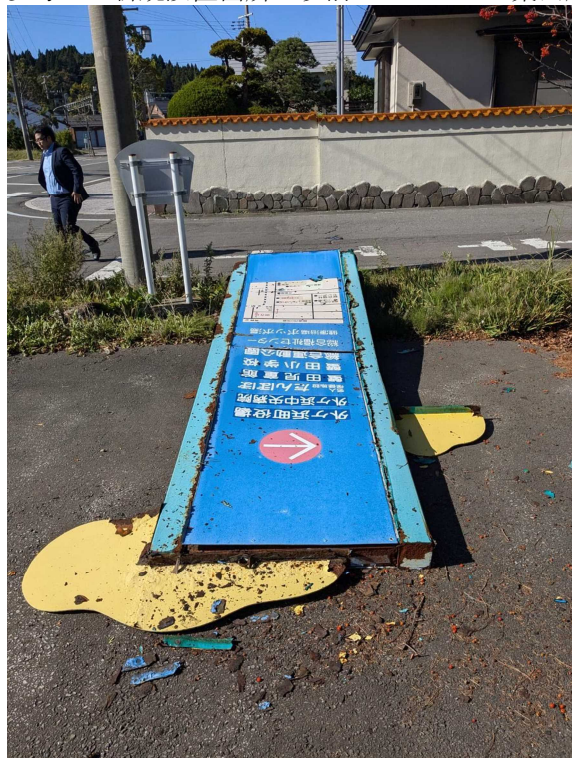
参考２：新規設置箇所に以前に立っていた案内板