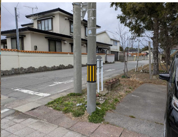
R6 年度に倒壊した案内板。現在は基礎だけが残っている。