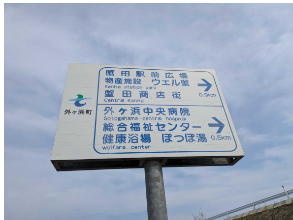
外ヶ浜町内各所 白地に青字（蟹田地区にもある）