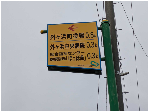
蟹田地区：黄色地に黒字