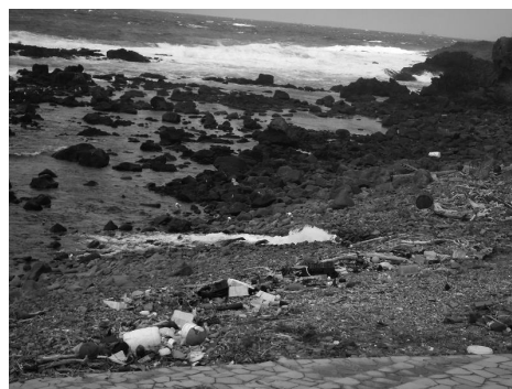
※龍飛崎海岸（令和7年2月27日撮影）