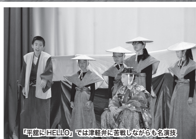
「平館にHELLO」では津軽弁に苦戦しながらも名演技