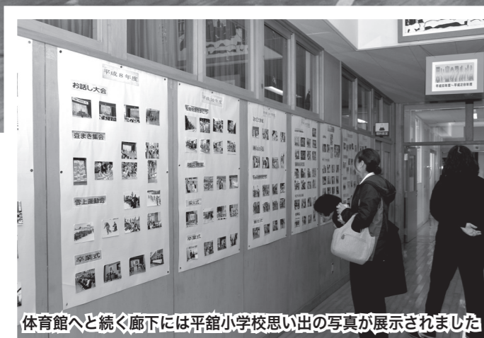
体育館へと続く廊下には平館小学校思い出の写真が展示されました