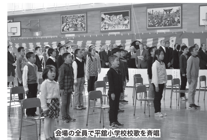
会場の全員で平館小学校校歌を斉唱